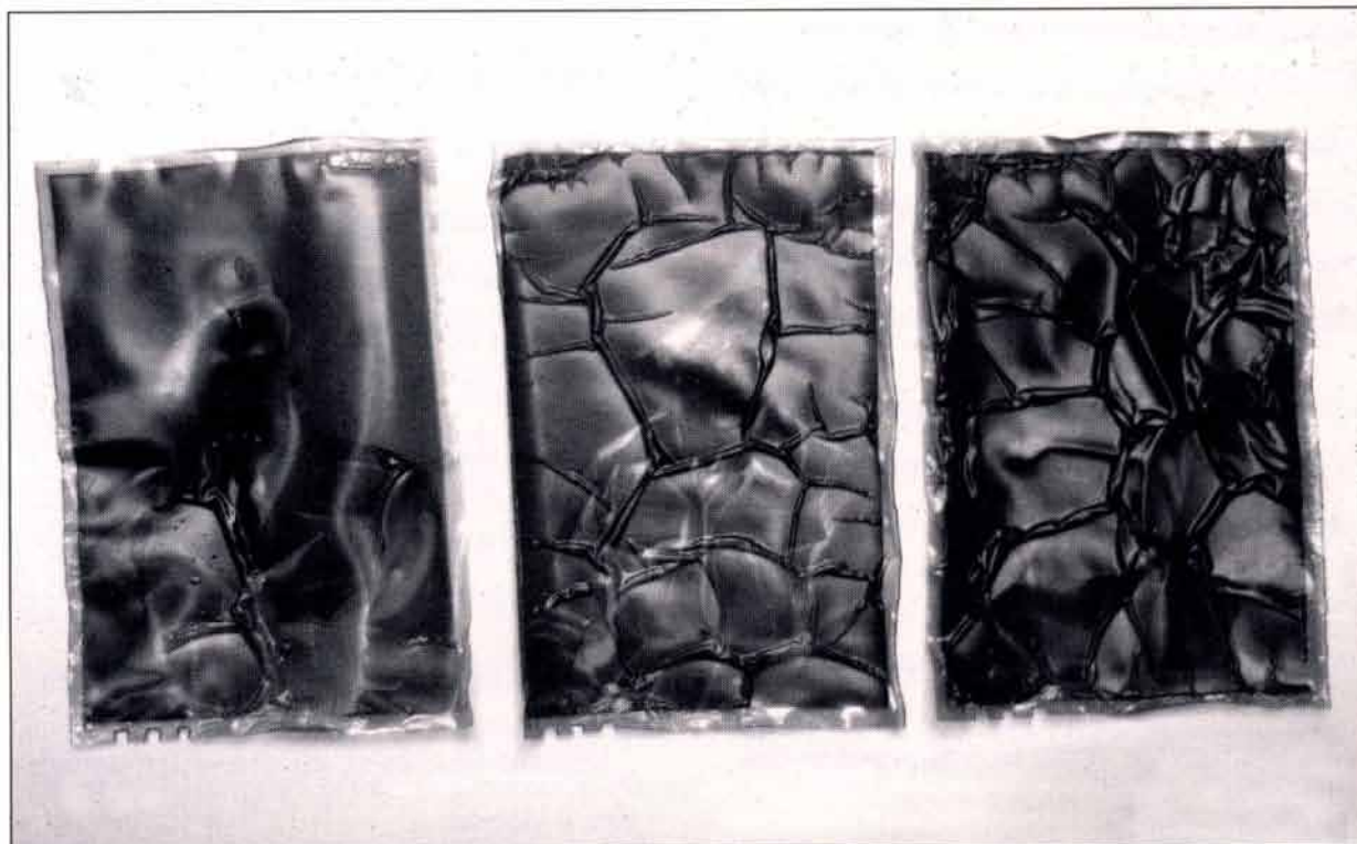
Détériorations des diacétates et cellulose